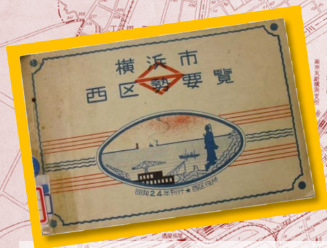
『横浜市西区勢要覽昭和 24 年版』 横浜市西区役所調査課／編・刊 1949

年表や地図で西区のあゆみを振り返りつつ、浮世絵や絵葉書、図書等の資料を展示します。