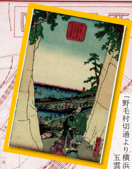
「野毛村切通より横浜遠望」 五雲亭貞秀